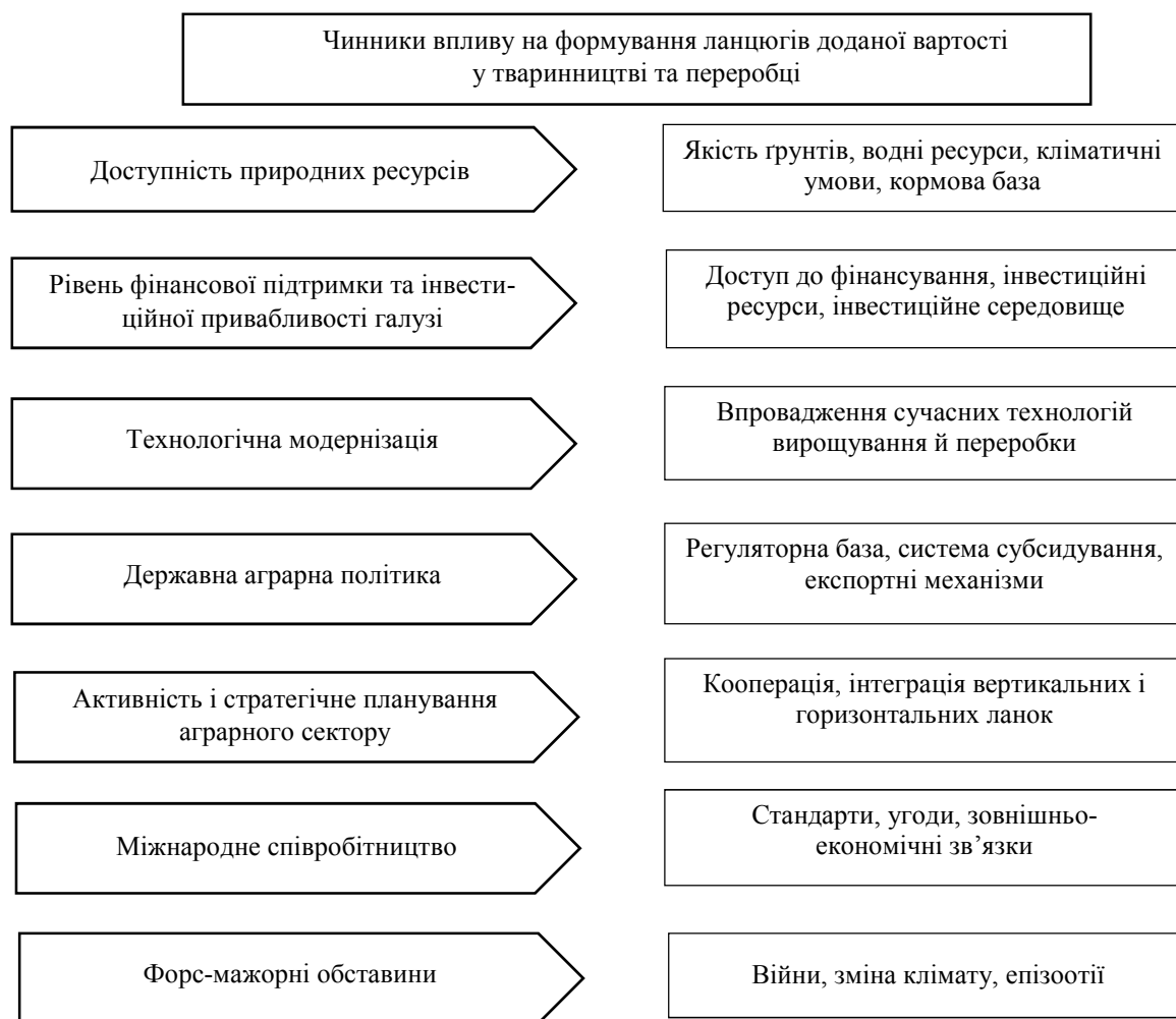
Рис. 2. Фактори, які впливають на формування ланцюгів доданої вартості в тваринництві та переробці

До основних чинників, що визначають можливість інтеграції тваринницьких господарств до ланцюгів доданої вартості належать: доступність природних ресурсів, рівень фінансової підтримки та інвестиційної привабливості галузі, технологічна модернізація, державна аграрна політика, активність і стратегічне планування приватного сектору, міжнародне співробітництво, форс-мажорні обставини (рис. 2).