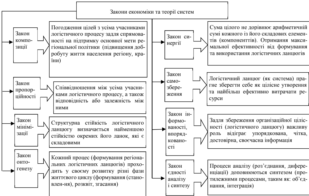
Рис. 1. Вплив законів економіки та теорії систем на логістичний процес (розробка автора)