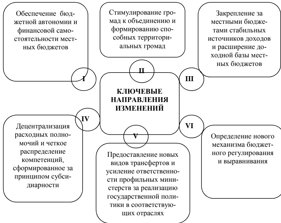
Рис. 2. Основные направления реформирования бюджетной системы [11]

Закон «О сотрудничестве территориальных общин» [13] создал условия для введения в Украине 5-ти юридических форм сотрудничества, что стало особенно актуально для общин после начала реального процесса децентрализации, когда важные полномочия органов исполнительной власти передаются местному самоуправлению при условии, что оно может реализовывать эти полномочия. Например, передача полномочий от Государственной архитектурно-строительной инспекции органа местного самоуправления требует создания последним собственного бюро, где должен работать сертифицированный архитектор. Большинство сельских общин не в состоянии создать и содержать такое бюро (службу), но они могут его создать в рамках сотрудничества.