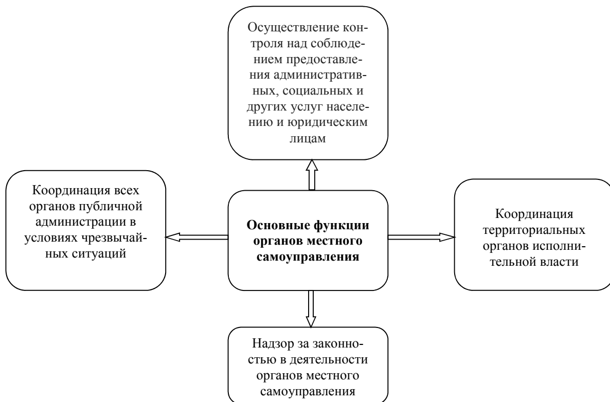
Рис. 1. Основные функции органов местного самоуправления [12]

4 шаг. Полностью обновить бюджетную систему (рис. 2).