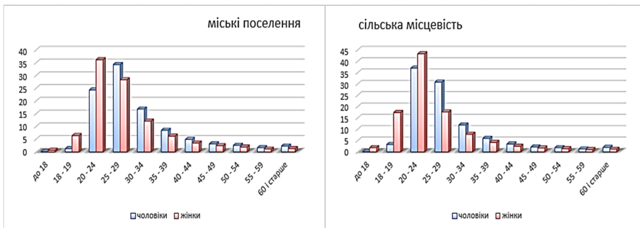
Рис. 3. Повікові коефіцієнти шлюбності міського та сільського населення Луганської області у 2013 р.

сімейних відносин. Середній вік чоловіків у міських та сільських поселеннях в Луганській області на 2014 р., які вперше взяли шлюб становить 28,0 років, жінок – 25,4 років [6, с. 59] (рис. 3).