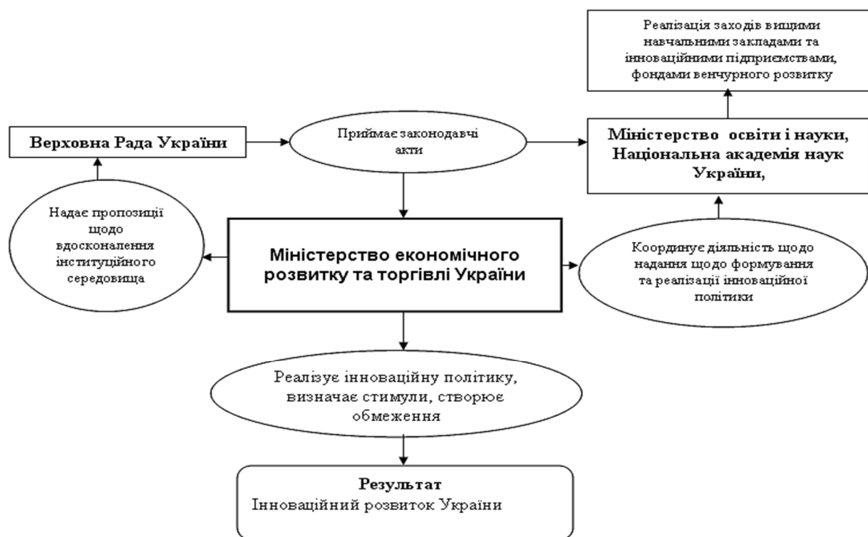
Рис. 3. Схема координації державних та законодавчих органів щодо активізації інноваційного розвитку [авторська розробка]

Для усунення цих перешкод необхідно визначити пріоритетні цілі як для національних, так і регіональних програм.