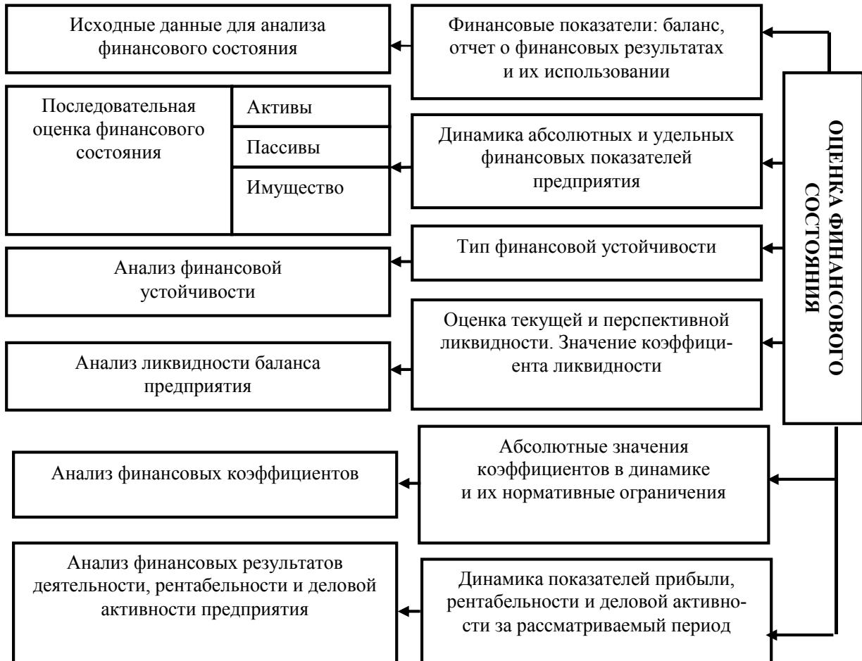
Рис. 2. Схема анализа финансового состояния предприятия [8]

Схематично анализ финансового состояния предприятия можно представить следующим образом (см. рис. 2).