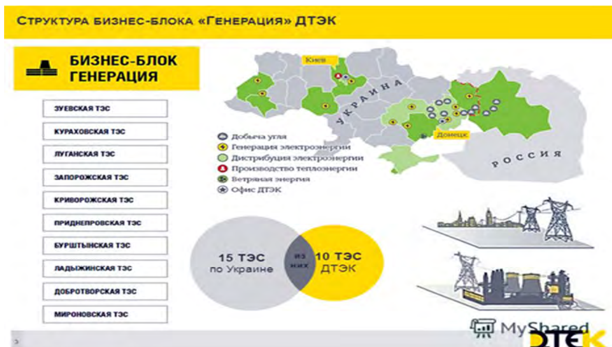
Рис. 1. Структура бізнес-блоку «Генерація» ДПЕК

ними конфліктами. Вочевидь, немає проблем у "ДПЕК Західенерго" і з платіжною дисципліною клієнтів. П'ята за розміром енергогенеруюча компанія України зі встановленою потужністю 4707,5 МВт активно продає електроенергію на експорт в країни Європи (рис. 1).