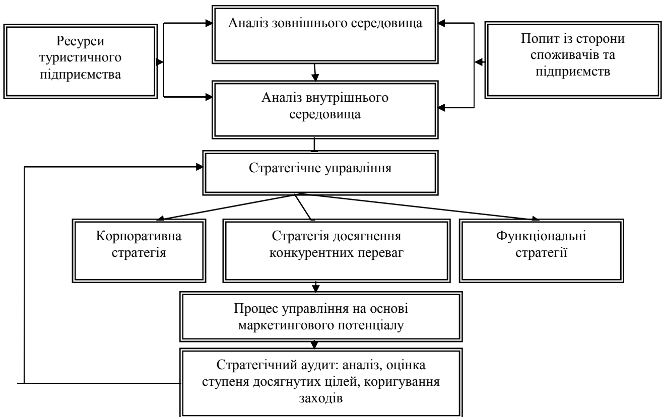
Рис. 2. Структурно - логічна схема досягнення конкурентних переваг підприємством туристичної індустрії в контексті формування економічної безпеки

I етап. Дослідження макросередовища підприємства туристичної індустрії: метод теоретичного узагальнення, прийом SWOT-аналізу і PEST – аналізу.