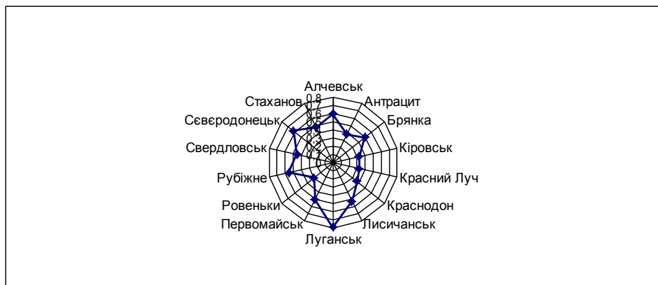
Рис. 1. Розподіл міст Луганської області за інтегральним показником розвитку малого підприємництва у 2011 р.

Для більш повної характеристики рівня розвитку малого бізнесу регіону, проведемо його оцінку за вида-