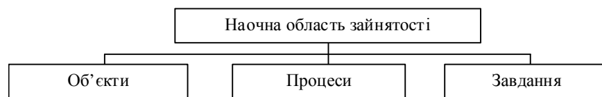
Рис. 1. Структура логіко-семантичної моделі наочної області зайнятості

Логіко-семантичний аналіз дозволяє продовжити класифікацію на наступному рівні [6], де потреби економічно активного населення класифікуються на зайняте / незайняте економічно активне населення та загальні / індивідуальні його потреби; умови праці – на виробничі, фінансові, побутові, дозвілєві умови праці та трансфер до місця праці; найцікавішими з погляду дослідження трансформації інституту зайнятості на сучасному ринку праці є нестандартні форми зайнятості, класифікація яких складається з 11 елементів, і представлена такими формами: індивідуальна трудова діяльність; підприємництво у сфері малого бізнесу; бездоговірні форми зайнятості;