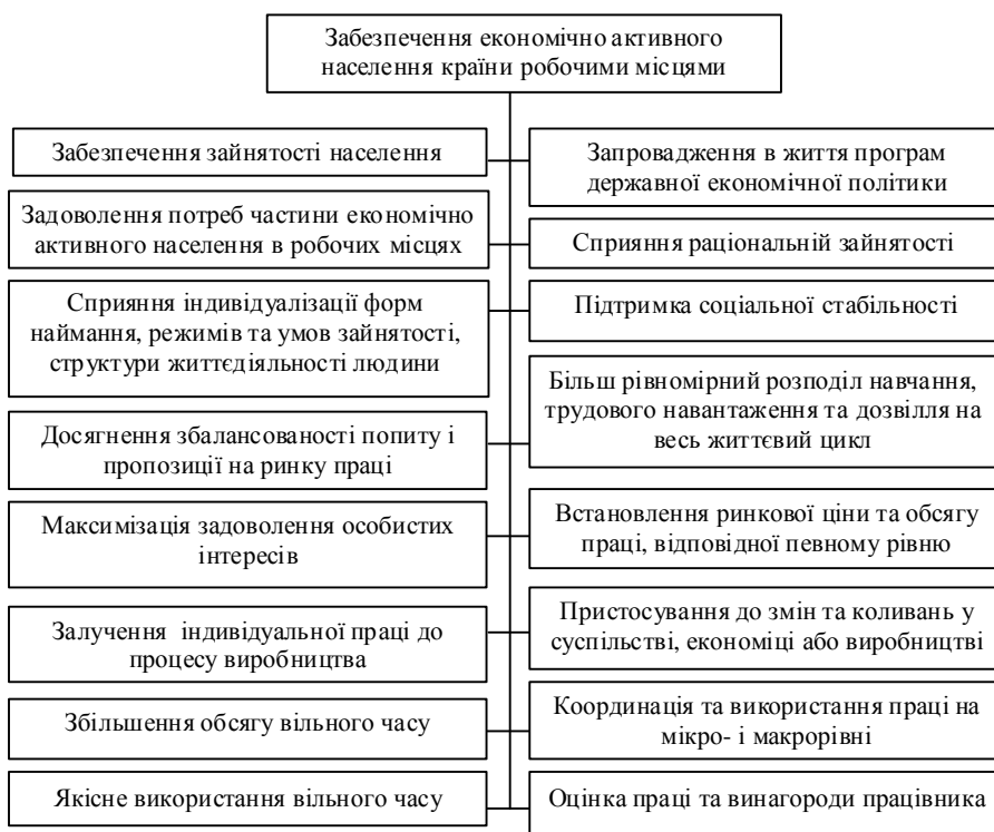
Рис. 4. Завдання логіко-семантичної моделі наочної області зайнятості

неповна, непостійна, вторинна, та неформальна зайнятість; недо(пере)зайнятість; зайнятість у домашньому господарстві та волонтерська діяльність.