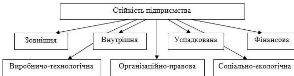
Рис. 1. Види стійкості сільськогосподарських підприємств в економічному аспекті