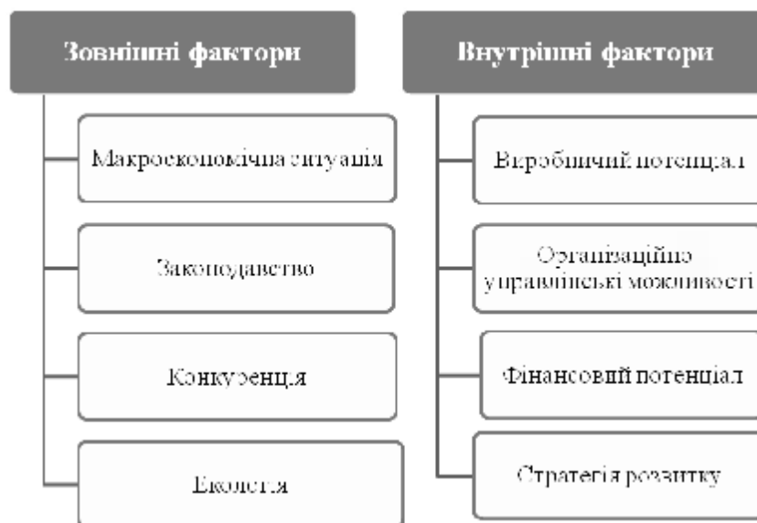
Рис. 3. Фактори внутрішнього та зовнішнього впливу