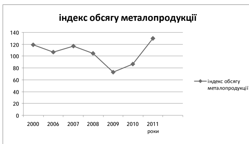
Рис. 1. Індекси обсягу продукції металургійного виробництва та виробництва готових металевих виробів у Луганській області (відсотків до попереднього року)

Майже 95% продукції металургійної галузі Луганщини дають ПАТ „Алчевський металургійний комбінат”, ПАТ „Стахановський завод феросплавів”, Лутугінський науково-виробничий валковий комбінат, ПАТ „Лугансь-