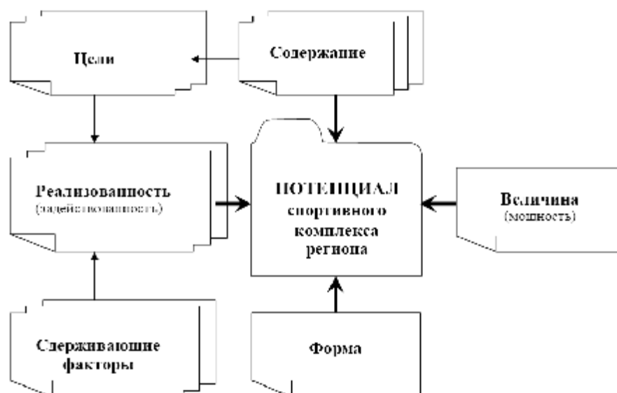
Рис. 2. Структура понятия „потенциал спортивного комплекса региона”

ринговой деятельности, но комплексный характер диагностики сближает ее и с научной деятельностью, и с финансово-хозяйственной, понимаемой в широком смысле (включая планирование на основе анализа и управление на основе диагностики). Как правило, проведение любых спортивных мероприятий требует определенных затрат – материальных, финансовых, людских. С другой стороны, каждое спортивное событие, прошедшее или предстоящее, оказывает существенное влияние на развитие всего региона в целом. При этом последствия могут быть положительными, отрицательными или нейтральными, и касаться самых различных аспектов жизни региона. Поэтому тщательная классификация возможных последствий спортивных мероприятий и их оценка с точки зрения имеющегося потенциала также важны для экономической диагностики.