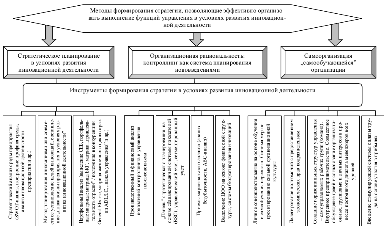
Рис. 2. Классификация методов и инструментов формирования стратегии в условиях развития инновационной деятельности

В настоящее время накоплен значительный объем методических средств и инструментов, используемых