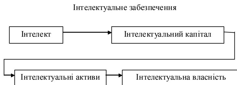
Рис. 4. Інтелектуальне забезпечення підприємства