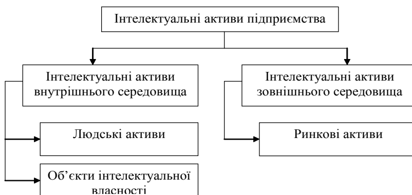
Рис. 3. Класифікація інтелектуальних активів підприємства

Мікрофакторами треба вважати споживачів (уподобання в асортименті продукції, тенденції розвитку, обсяги споживання, рівень платоспроможності), конкурентів (ступінь освоєння ринку, асортимент продукції конкурентів, ціна, якість, інноваційність пропонованої продукції), постачальників (види сировини, що поста-