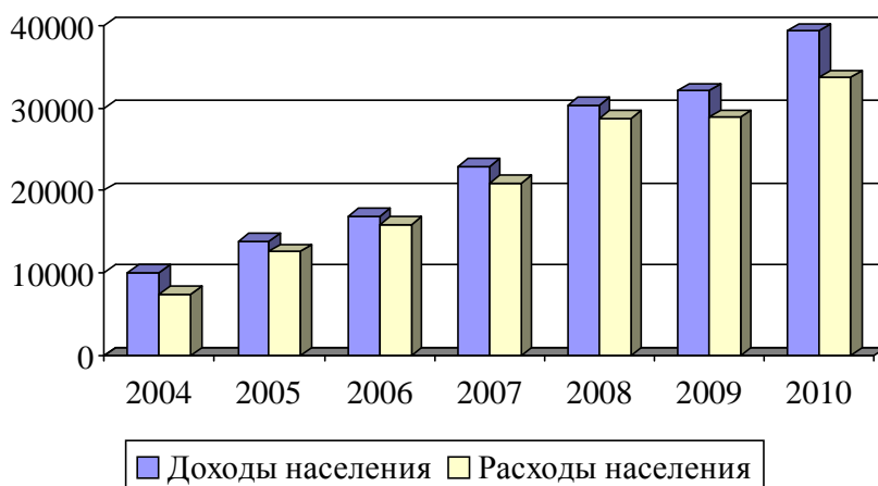
Рис. 1. Динамика доходов и расходов населения АР Крым, млн грн