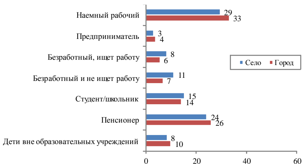
Рис. 3. Занятость населения в Крыму по типу населенного пункта