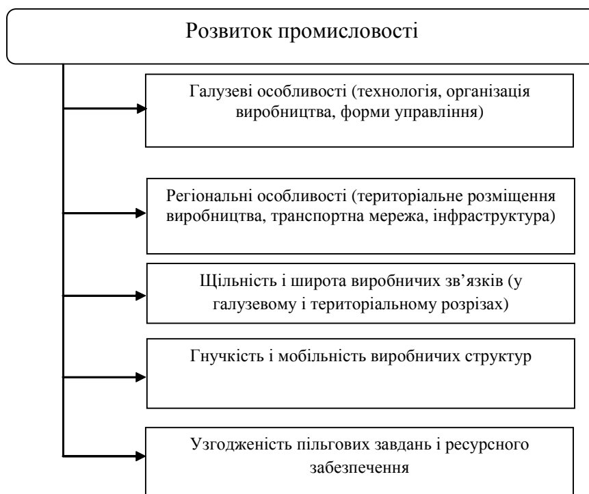
Рис. 1. Фактори впливу на розвиток промисловості [11]

з іншого, — зростання масштабів диференціації виробництва під впливом численних чинників науково-технічного прогресу. Обидва ці явища не є новими для економіки, оскільки такі тенденції сформувався досить давно. Однак, в останнє десятиліття вони набули низки нових змістових ознак.