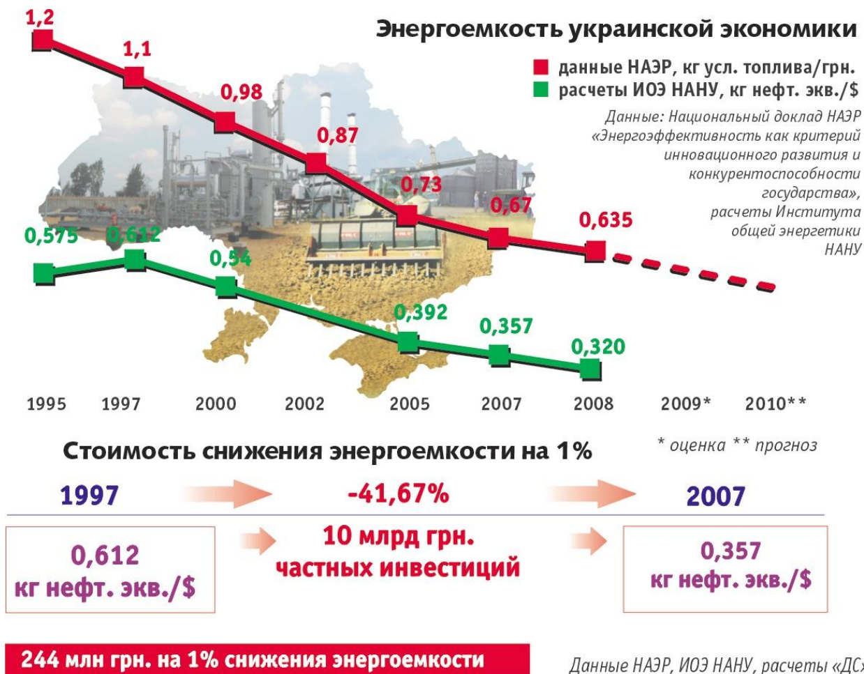
Рис. 3. Энергоемкость украинской экономики [11]

производимая альтернативной генерацией (ВЭС, солнечные батареи, ГЭС мощностью до 10 МВт). Но соответствующий закон был принят лишь в прошлом году. Уровень тарифов определяется с учетом специального коэффициента (колеблется в пределах 0,8 — 4,8 в зависимости от мощности и вида альтернативного энергогенерирующего агрегата). Так, для установок, производящих электроэнергию из биомассы, этот коэффициент составляет 2,3; для ветроэлектростанций мощностью свыше 2 МВт — 2,1; для установок, вырабатывающих ток за счет потребления солнечного излучения, — 4,8. Сразу после этого нововведения энергия, которую производит ВЭС мощностью 2 МВт и более, подорожала на 50% — до 1,2 грн/кВт-ч, стоимость тока, производимого солнечными энергоустановками, выросла в 3,5 раза — более чем 2,8 грн/кВт-ч. Благодаря этому срок окупаемости ветроэлектростанций и солнечных батарей сократился с нескольких десятилетий до семи-восьми лет. Однако и этот закон специалисты считают несовершенным [11].