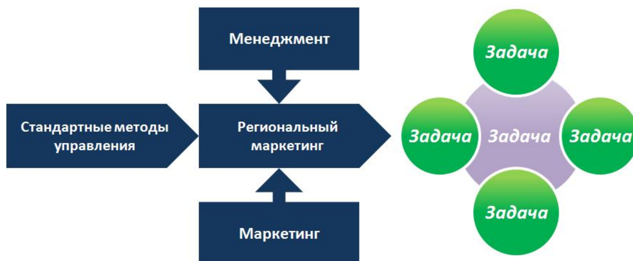
Рис. 1. Модель регионального маркетинга

того, что в условиях сложной современной многоуровневой экономики изменяются цели, задачи и инструменты управления. А возросшая самостоятельность регионов создает предпосылки для того, чтобы в большей степени учитывались различия и экономическую специфику регионов. При этом конкурентоспособность становится одним из главных критериев сравнения городов, областей, регионов.