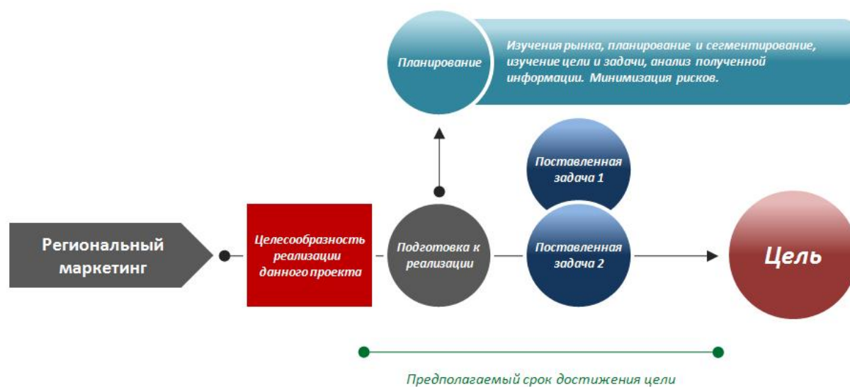
Рис. 3. Модель управления проектом методом регионального маркетинга

вания, изучения рынка и сегментирования аудитории приводит зачастую к тому, что даже реализованные и завершенные проекты оказываются никому не нужны. Иными словами, создаваемый актив не может найти не только потребителей, но и становится неуправляемым, так как не может органично взаимодействовать с другими элементами рынка региона.