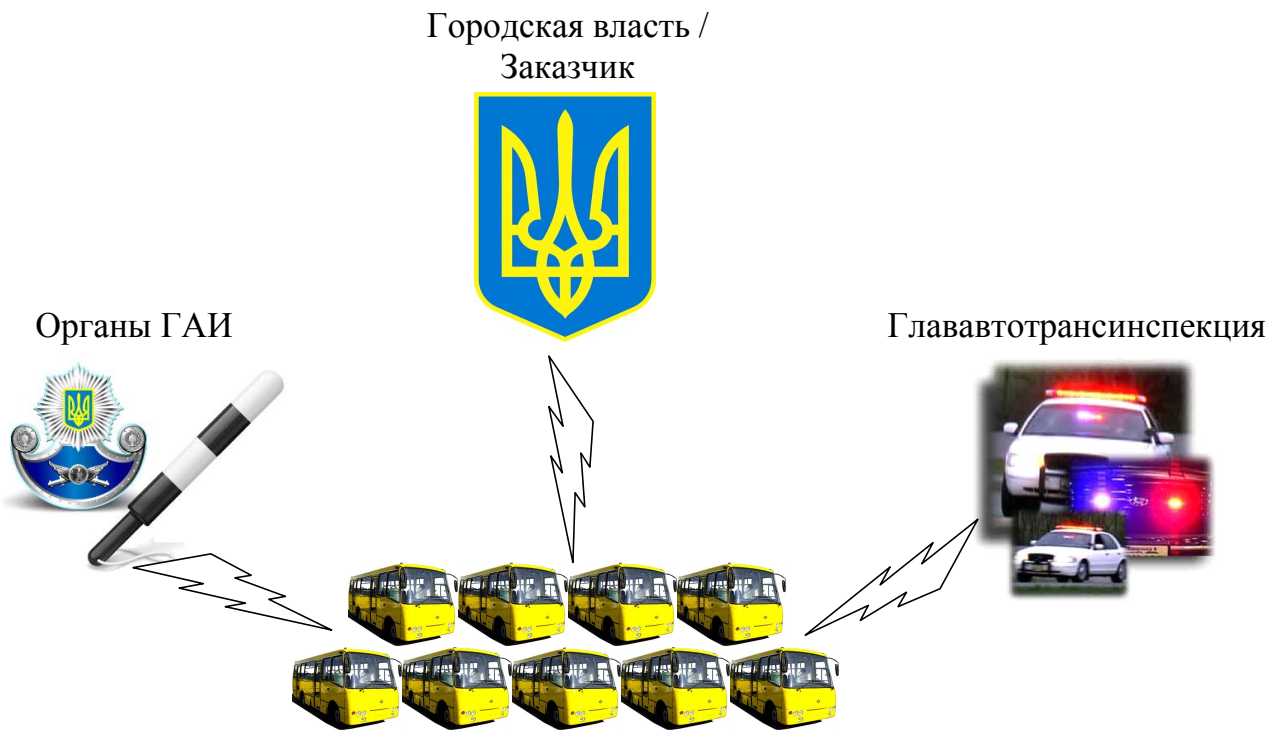
Рис. 2. Схема подотчетности АТП

ния дорожно-транспортных происшествий с участием пассажирского транспорта.