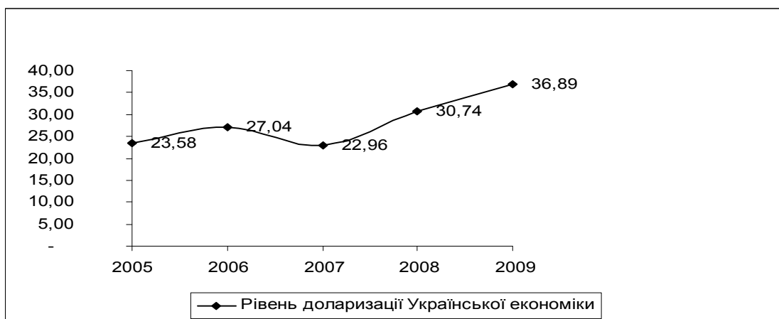
Рис. 3. Динаміка рівня депозитної доларизації в Україні, 2005 — 2009 рр. [1]