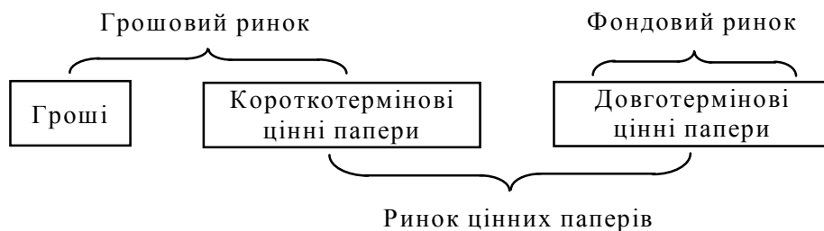
Рис. 1. Узгодження понять «грошовий ринок», «фондовий ринок (ринок капіталу)» і «ринок цінних паперів» [4, с. 11]

З наведеного рис. 2. фінансовий ринок представлений площею великого кола, який поділений на дві частини: ринок капіталів та грошовий ринок. У середині фінансового ринку функціонує ринок цінних паперів (мале коло), який є сегментом грошового ринку та ринку капіталів. Професор Н.Й. Берзон наголошує, що як синонім ринку цінних паперів використовується термін фондовий ринок — це ринок, на якому торгують специфічним товаром — цінними паперами. Реально ці папери практично нічого не коштують, однак їхня цінність визначається активами (майном, коштовностями), які стоять за цими паперами [1, с. 7].