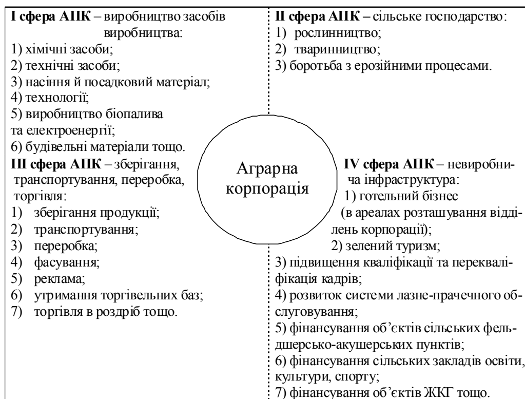
Рис. 1. Перспективні напрямки діяльності аграрної корпорації

власний фінансовий ризик, якщо купуватиме акції кількох корпорацій. Кредитори можуть надати претензії лише корпорації як юридичній особі, а не окремим акціонерам як фізичним особам.