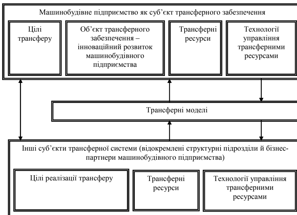
Рис. 1. Система трансферного забезпечення розвитку інноваційної діяльності машинобудівного підприємства

яка є предметом трансферних відносин машинобудівного підприємства з іншими організаціями або з власними відокремленими підрозділами (представництва, материнські й дочірні компанії тощо). З огляду на це, інноваційні ресурси доцільно поділити на власні і трансферні. До трансферних інноваційних ресурсів належать права власності на активи, науково-технологічна інформація, інноваційні продукти і технології, фінансові ресурси, працівники підприємства та інших організацій як носії технологічної інформації.